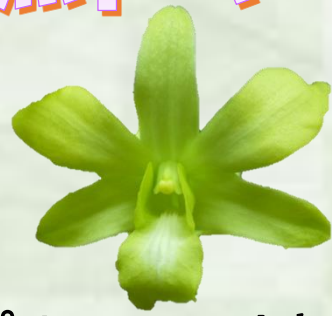
プリティーミサキ